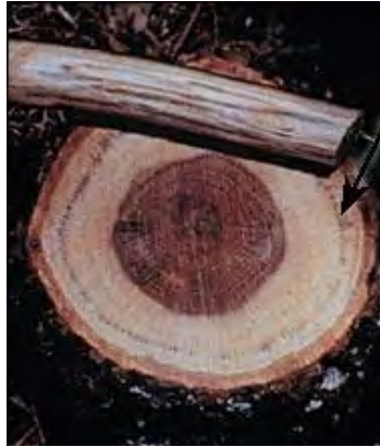
Figure 7. Tache noire – coupe transversale (USDA Forest Service).