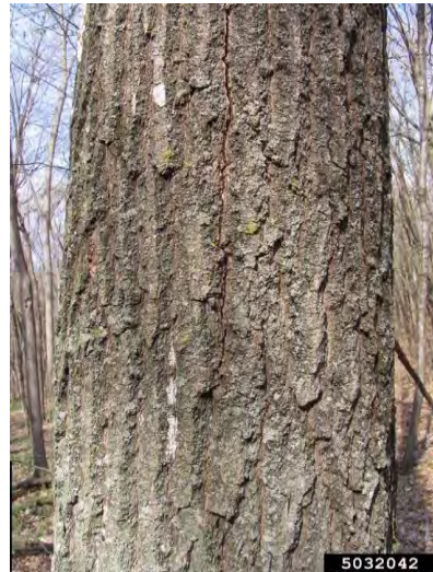
Figure 4. Fissures verticales dans l'écorce indiquant la présence d'une structure sporifère sous l'écorce.