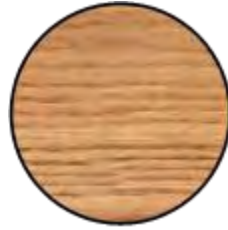
Figure 6. Des échantillons de branches fraîches et humides d'un diamètre minimum de 3 cm constituent le point de mire du diagnostic de cette enquête.