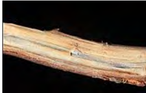
Figure 8. Tache noire longitudinale – coupe longitudinale.