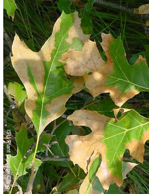
Figure 2. Bord distinct de feuilles infectées (Iowa State University).

Les champignons, qui forment des structures comprimées, sont composés de mycéliums foncés qui peuvent être logés sous l'écorce des arbres infectés (figure 3). Il arrive parfois que ces structures comprimées provoquent la fissuration de l'écorce (figure 4) et dégagent une odeur semblable à celle de la gomme « Juicy Fruit ».