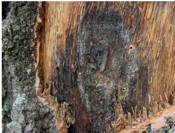
Figure 3. Champignon formant une structure comprimée sous l'écorce.

Les champignons, qui forment des structures comprimées, sont composés de mycéliums foncés qui peuvent être logés sous l'écorce des arbres infectés (figure 3). Il arrive parfois que ces structures comprimées provoquent la fissuration de l'écorce (figure 4) et dégagent une odeur semblable à celle de la gomme « Juicy Fruit ».